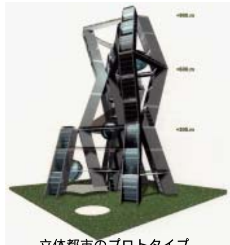
立体都市のプロトタイプ

立体都市では生活空間は効率よくコンパクトにまとめられる。人々が快適に生活するためには、エアマスを各所に分散配置し、それぞれがネットワークを組んでエアマスの効果を共有しあうことが重要となる。